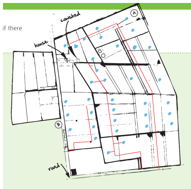
Bild 2. Enkel karta över betesmarker för att hålla koll på ledningar och risker för läckage (DairyNZ, 2019)

Vattenledningar på beten kan lätt bli bortglömda, och läckor därför svåra att upptäcka. Håll utkik efter blöta ställen eller platser där det fortfarande växer grönt fast det är torrt runtomkring. Rådgivning från Nya Zeeland (Dairy NZ, 2019) tipsar om att man här har användning av en enkel karta där man markerar kopplingar och kranar, för att alla i personalen ska känna till hur vattensystemet ser ut och därmed kunna hjälpas åt att hålla koll.